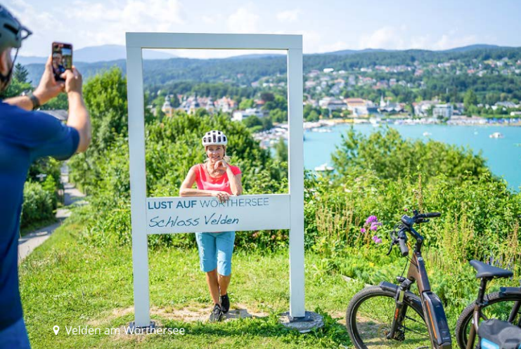
📍 Velden am Wörthersee