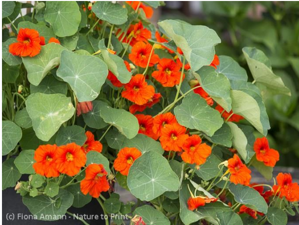
Abbildung 3: Die vielseitig verwendbare Kapuzinerkresse sollte in keinem Garten fehlen!