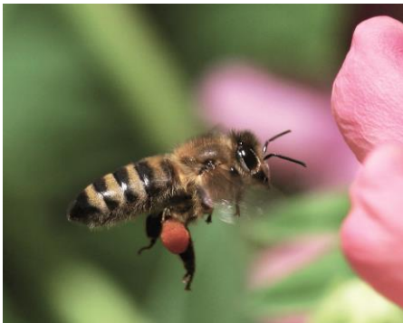
Abbildung 1: Honigbienen spielen bei der Bestäubung von Blüten eine zentrale Rolle

Bienen, Hummeln, Schmetterlinge und andere Insekten sind Nützlinge, auf die auch wir Menschen angewiesen sind. Denn ohne die Bestäubung von Pflanzen durch Insekten, allen voran die Honigbiene, sind große Teile der landwirtschaftlichen Produktion nicht möglich. Durch ein mangelndes Nahrungsangebot und verschiedene Umweltgifte haben es unsere kleinen Helfer jedoch zunehmend schwerer.