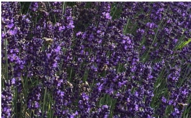
Abbildung 5: Von Bienen gut besuchter Lavendel

Wussten Sie, dass Pelargonien, Petunien und Geranien der Biene keine Nahrung bieten? Auch gefüllte Blüten sind für Bienen schwer zugänglich. Alternative Balkon- und Topfpflanzen sind z.B. Kapuzinerkresse (kann auch gegessen werden!), Mohn, Lavendel, BeeDance (Goldmarie od. Zweizahn), Wandelröschen, Löwenmaul, Gazanie, Malven, Ballonblume und viele mehr.