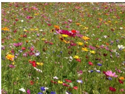
Abbildung 2: Blickfang Blumenwiese

Blühflächen mit Wildblumen sind nicht nur ein optischer Blickfang im Garten, Sie füttern damit auch Bienen und viele andere Insekten. Ob Blumenwiese, Blühstreifen, Rabatte oder Blumeninsel – lassen Sie wieder ein kleines Stück blühende Wildnis zu! Fast alle Wiesenblumenarten werden von den Bienen gerne angenommen - dazu zählen z.B. Wiesensalbei, Ringelblumen, die meisten Kleearten, Klatschmohn, Buchweizen, Leimkraut, Disteln, Wilde Möhre, Esparsette, Färberkamille, Kornblume, Glockenblume, Kornrade und Wiesenflockenblume.