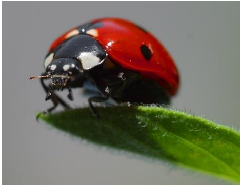
Abbildung 7: Marienkäfer und ihre Larven fressen am Tag bis zu 150 Blattläuse.

Spritzmittel (Pestizide, Fungizide) sind bereits in geringer Dosis sehr giftig für Bienen und andere Nutztiere! Vermeiden Sie bitte deren Einsatz im gesamten Haus- und Gartenbereich! Mit biologischen Mitteln (z.B. Brennnesseljauche, EM-Produkten, Einsatz von Nützlingen) und alternativen Betriebsweisen (Mulchen, Mischkulturen) tun sie nicht nur Bienen und Co sondern auch ihrer Familie viel Gutes!