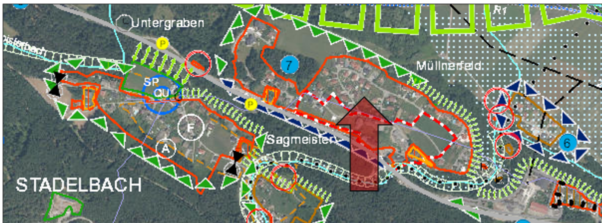
Ausschnitt Örtliches Entwicklungskonzept der Marktgemeinde Weißenstein

Im Örtlichen Entwicklungskonzept der Marktgemeinde Weißenstein wird Stadelbach als Ortschaft mit Entwicklungsfähigkeit u.a. für Wohnfunktion erfasst. Das Planungsgebiet dieser Verordnung befindet sich vollständig innerhalb der absoluten Siedlungsgrenzen. Erweiterungsmöglichkeiten bestehen naturräumlich bedingt lediglich in nordwestliche Richtung.